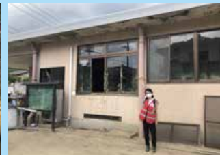
浸水被害を受けた避難所(熊本県)