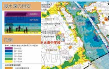
ハザードマップ