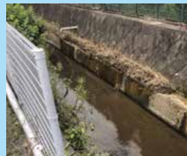
こんな用水路すら氾濫(熊本県)