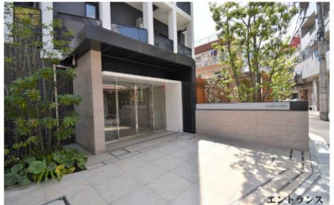
*このハウジングマップは概要紹介図です。図面と現況が異なる場合は現況優先となります。

～オーナーチェンジ物件～ ■月額収入：108,000円（管理費込） ■年間収入：1,296,000円 ■表面利回り：約3.52% ※利回りは、年間予定賃料収入の当該物件の購入金額に対する割合です。 ※予定賃料収入は将来にわたり確実に得られることを保証するものではありません。 ※利回りは公租公課その他当該物件を維持するために必要な費用の控除前のものです。