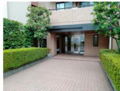
エントランス前アプローチ