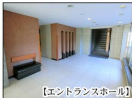
【エントランスホール】